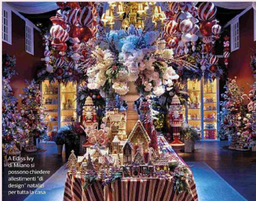
A Ecliss Ivy di Milano si possono chiedere allestimenti "di design" natalizi per tutta la casa