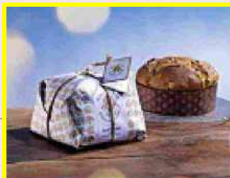
Panettone sospeso L'iniziativa benefica è di 13 pasticcerie milanesi

Per alberisti all'ennesima potenza, a Milano, tra gli indirizzi da esplorare, c'è Ecliss Ivy (Ripa di Porta Ticinese 73): qui gli alberi si possono acquistare interi (con tutti gli addobbi), o addirittura richiedere un progetto per un allestimento natalizio "di design" che coinvolga tutta la casa (in vendita anche ghirlande, centrotavola, candele e water globe a bat-